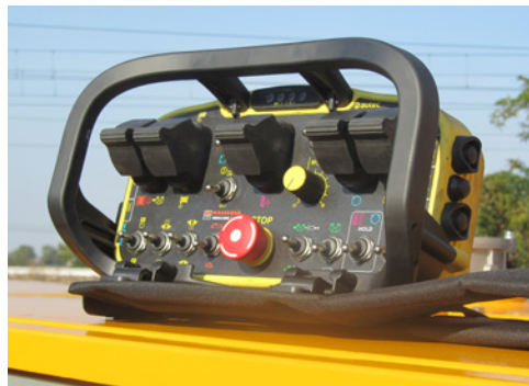
Radiocomando Radio remote control Télécommande Mando a distancia Fernbedienung Пульт радиоуправления