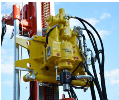
Testa roto-percussione Hydraulic drifter Tête roto percusion Hydraulikhammer Cabeza con martillo hidráulico Гидромолот