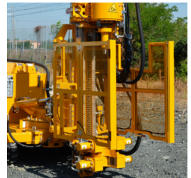
Barriera di sicurezza ad infrarossi Safety infrared barrier Barrière infrarouge de sécurité Barrera infrarroja de seguridad Sicherheitsinfrarotbarriere Защитный инфракрасный барьер