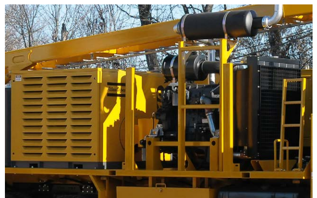
Compresore d'aria Air compressor Compresneur d'aire Kompressor Compresor de aire